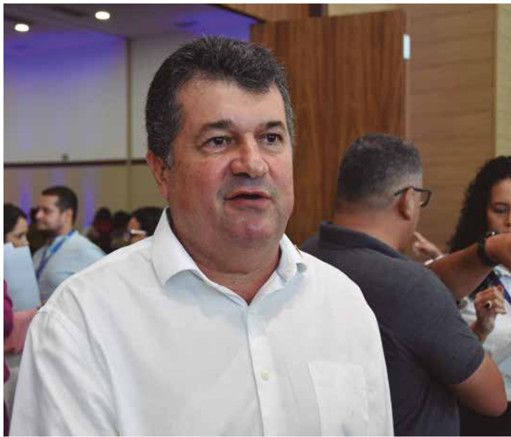
Para George, o encontro será importante para que os gestores compartilhem experiências

De acordo com a Secretaria de Relações Institucionais