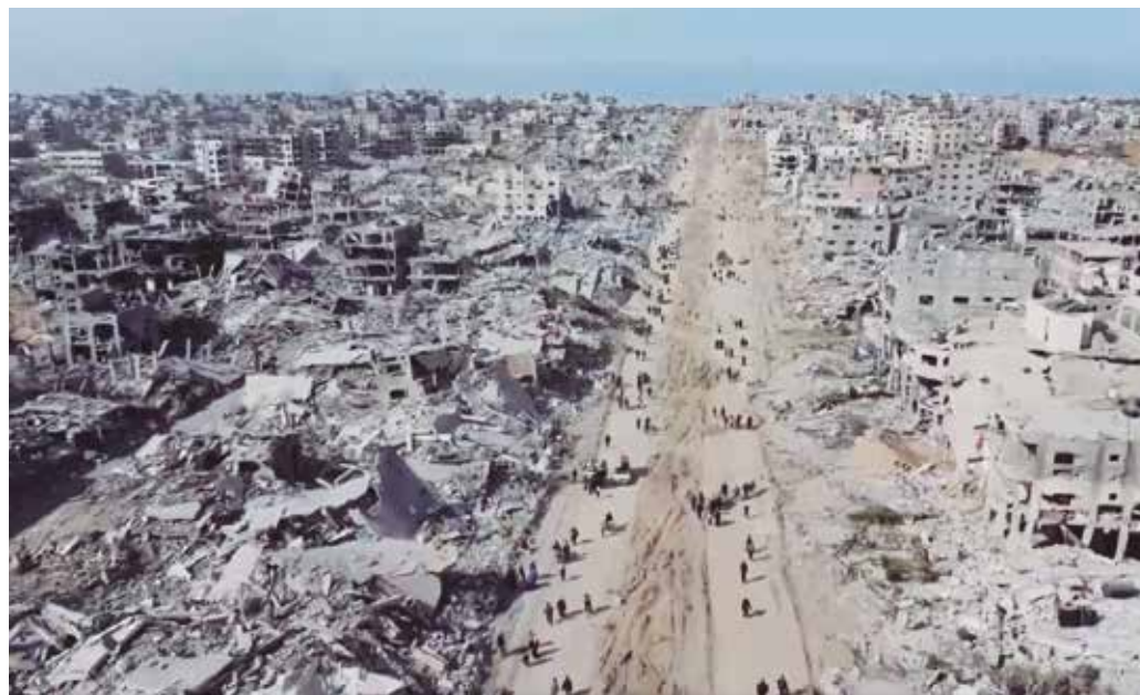
Segundo mediadores, o governo israelense dificultou a entrada de tendas e casas móveis em Gaza

O gabinete do primeiro-ministro israelense, Benjamin Netanyahu, disse estar comprometido com o acordo de cessar-fogo e que vai encarar qualquer violação pelo Hamas com severidade. O Fórum de Reféns e Famílias Desaparecidas, que re-