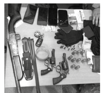
Material apreendido na ação

As equipes receberam informações de que o grupo estaria em um carro deixando a cidade de Campina Grande para cometer o crime. O veículo foi interceptado e os acusados, presos com os materiais. Dois deles são do estado de São Paulo e já tinham passagem pela polícia. O caso foi levado para a Cidade da Polícia Civil, em Campina Grande.