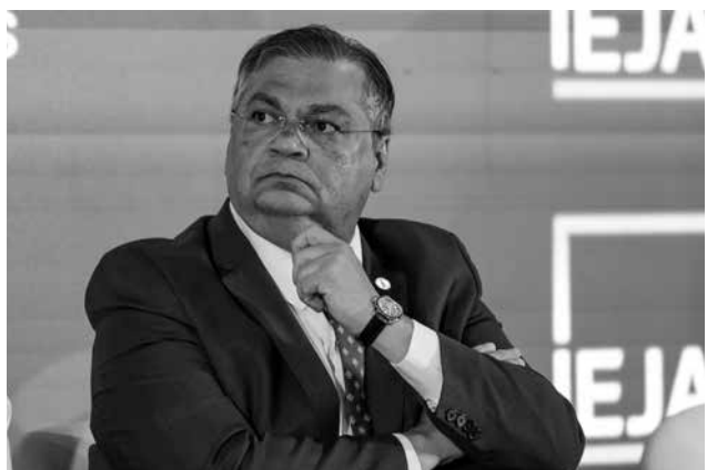
Ministro quer limitar remunerações no serviço público

a norma do CNJ autorizou o pagamento, mas não permite o repasse retroativo do auxílio.