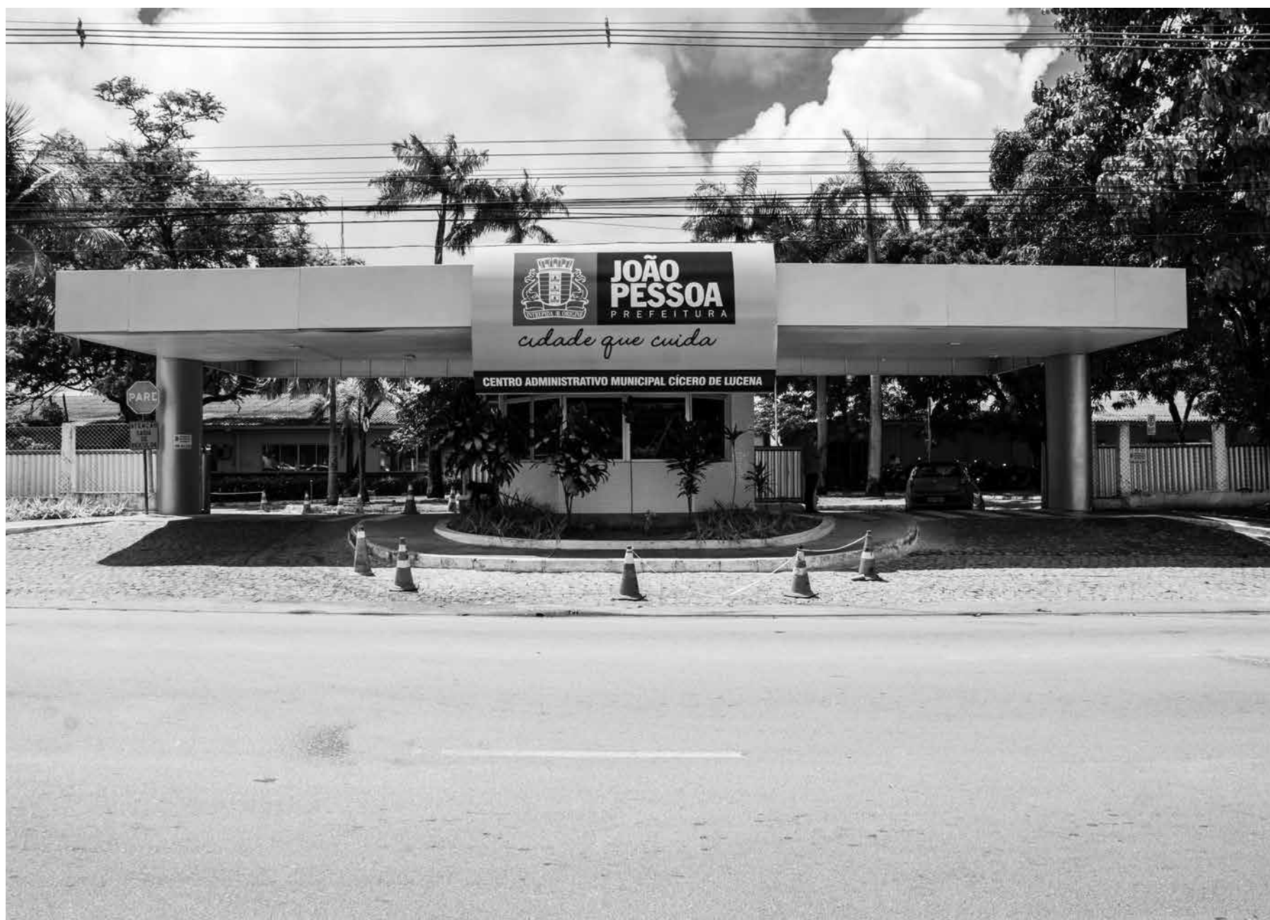
Boletos podem ser adquiridos via internet ou por meio do atendimento presencial da Receita no Centro Administrativo Municipal, em Água Fria

Outras formas de ter acesso aos boletos são por meio do atendimento presencial da Receita no Centro Administrativo Municipal, em Água Fria, ou no aplicativo Na Palma da Mão. O Portal do Contribuinte pode ser acessado no site da Prefeitura