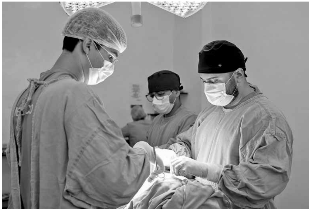
Mais de 1,4 mil usuários já foram atendidos e acompanhados pelos médicos do programa