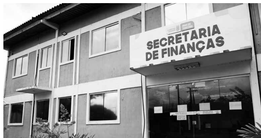
Em Campina, contribuinte poderá pedir o documento na sede da Sefin, na Estação Velha

De forma presencial, os campinenses também poderão ter acesso ao boleto na Secretaria Municipal