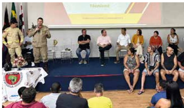
Objetivo do encontro foi reduzir os riscos à saúde dos foliões

A capacitação também contou com a parceria do Corpo de Bombeiros Militar da Paraíba, que orientou os comerciantes sobre os cuidados para se evitar acidentes.