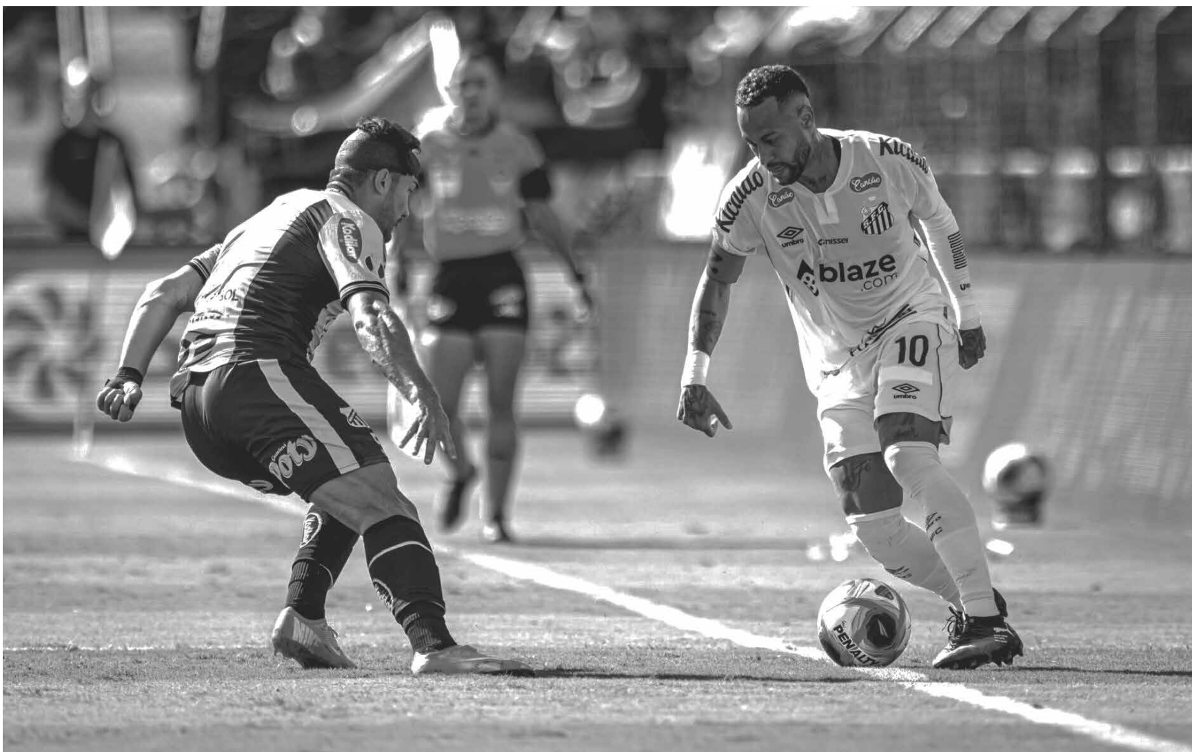
Neymar não empolgou contra o Novorizontino, e o Santos apenas empatou sem gols; amanhã ele pode ser utilizado diante do Corinthians

O próximo compromisso do Alvinegro praiano será um teste de fogo para Neymar: o clássico contra o Corinthians, amanhã, na Neo Química Arena. Com o empate com o Novorizontino, o Santos estacionou na terceira colocação do Grupo B, atrás de Guarani e Portuguesa, e precisa voltar às vitórias para entrar na zona de classificação às quartas de final do Campeonato Paulista. E isso dependerá também do desempenho de Neymar, que ainda precisa de tempo para readaptação. Para se ter uma ideia, antes da partida mais recente, ele não era titular havia mais de um ano.