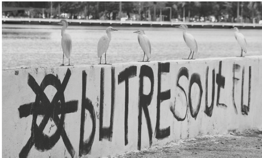
A batalha das aves pichadoras