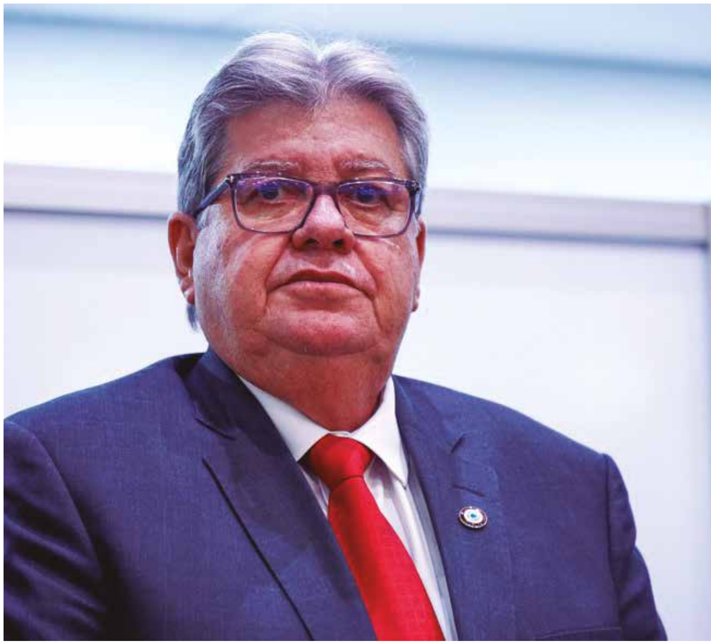
O governador João Azevêdo tirou o Polo Turístico do papel após 40 anos; atualmente há sete empreendimentos no local

Para fortalecer a interiorização do turismo, a gestão construirá o Museu de Arqueologia, em Cajazeiras; construirá o Museu e reformará e requalificará o Monumento Natural Vale dos Dinossauros, em Sousa; instituirá o programa para revitalização de Engenhos – ICMS Patrimonial e o Empreender Rural – Engenhos, em diversos municípios; e construirá a cobertura do anfiteatro do Santuário Pe. Ibiapina, em Solânea, e a Escola de Gastronomia e Hotelaria, na Comunidade Aratu, em João Pessoa.