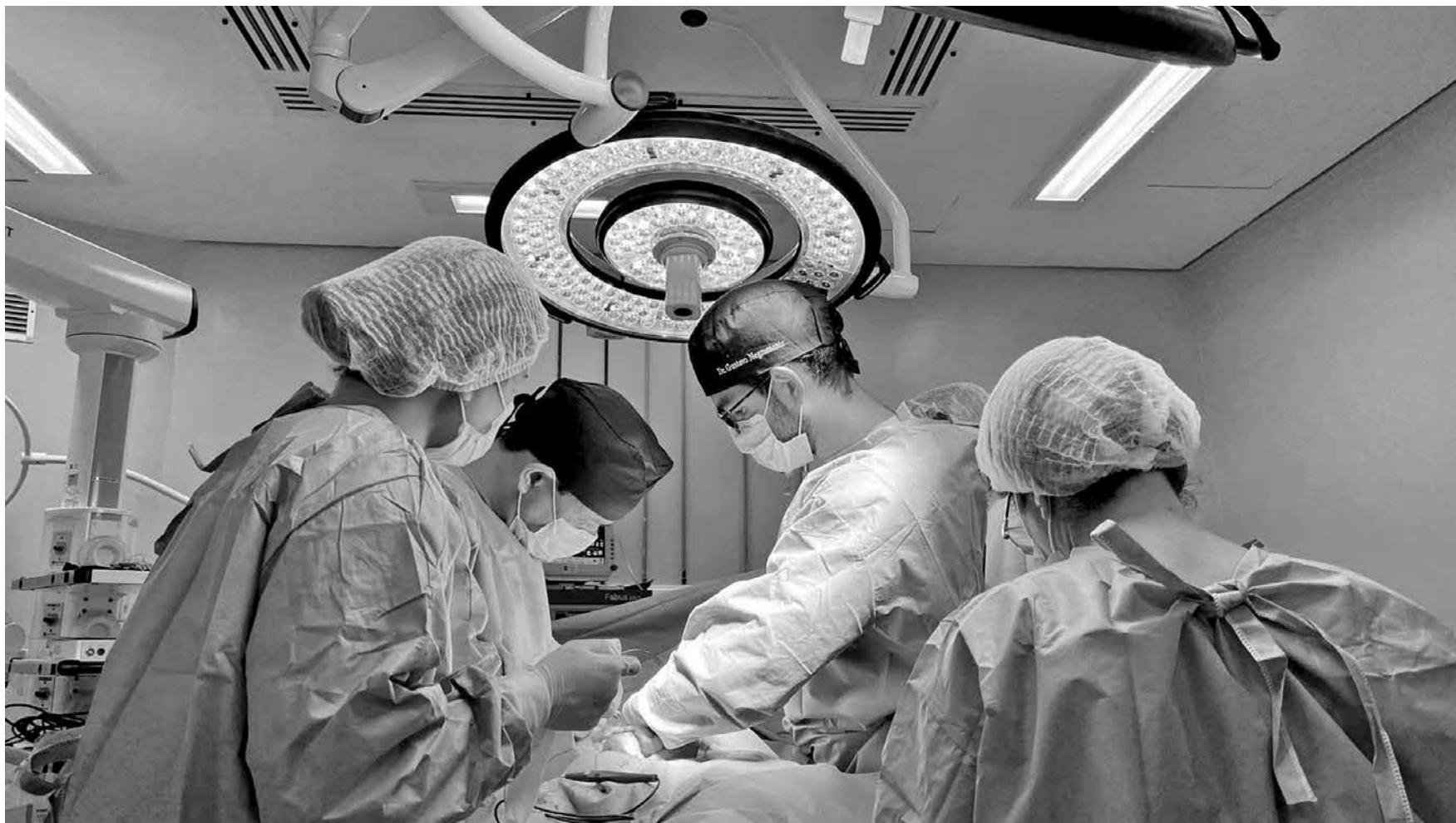
Procedimentos foram realizados no Hospital São Vicente de Paulo; a unidade filantrópica atende aos usuários do programa por meio do Complexo Regulador Estadual

Para ter acesso ao programa, o usuário precisa dar entrada por meio da Atenção Básica, onde é identificada a possibilidade ou a confirmação do diagnóstico de câncer. Em seguida, ocorre a avaliação por meio do Complexo Regulador Estadual. Após ser inserido na rede, o enfermeiro navegador acompanha o paciente durante todo o tratamento, auxiliando no agendamento de consulta com especialistas, marcação de exames e demais procedimentos necessários.