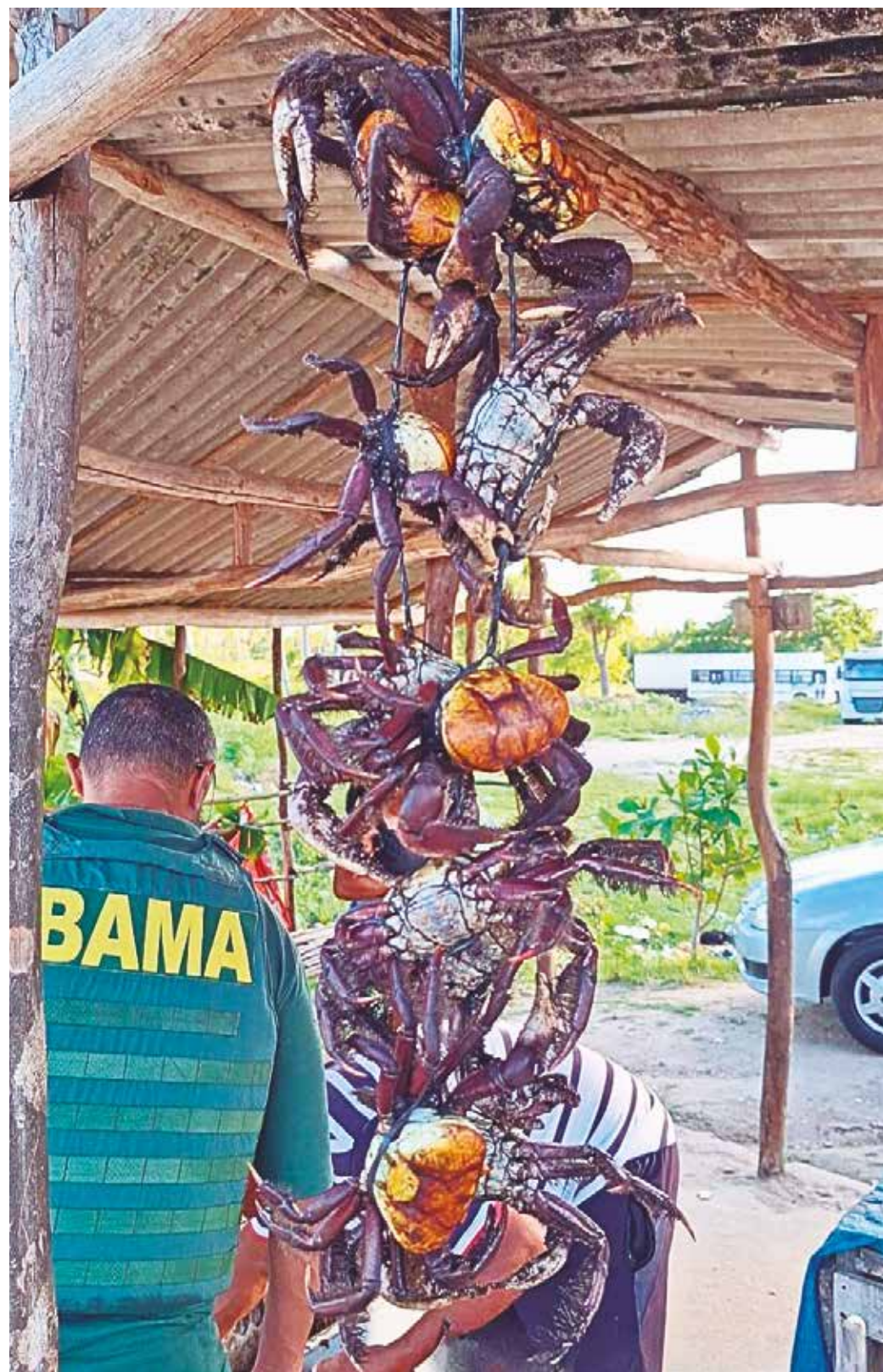
Profissionais atuaram em Mataraca, Santa Rita, Pitimbu, Mamanguape e Marcação

peças físicas e jurídicas que trabalham com o caranguejo-uçá devem apresentar uma declaração de estoque detalhada antes do início