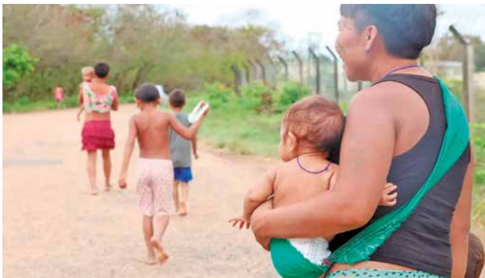
Os dados foram obtidos pelo Ministério da Saúde e pelo Instituto Nacional de Câncer