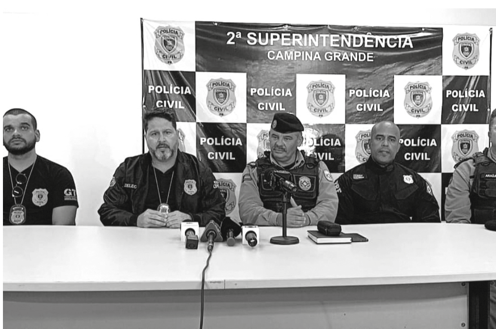
Policiais detalharam as investigações que levaram às prisões em menos de 24 horas

As equipes do GTE/Homicídios da Polícia Civil, em Esperança, iniciaram as investigações e identificaram a moto utilizada pelos criminosos. Características dos assaltantes também foram anotadas pelos policiais civis e militares, que realizaram coletas de imagens em circuitos de câmeras de segurança.