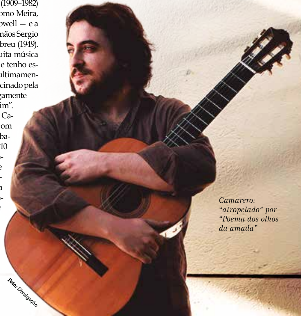
Camarero: “atropelado” por “Poema dos olhos da amada”

que ele toca... Foi um processo artístico feito com muito cuidado, muito carinho. Porque fazer homenagem é sempre uma coisa muito perigosa. Por melhor que seja a intenção, a gente pode cair num lugar perigoso de imitação ou de pastiche. Não pode exagerar muito. Mas eu tava absolutamente em casa e toquei à vontade”.