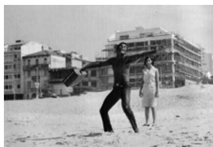
A GRANDE CIDADE

O filme de 1962 foi o primeiro longa dirigido por Cacá Diegues, abordando a vida do primeiro líder do Quilombo de Palmares, símbolo da resistência de escravizados no Brasil. O diretor chegou a dirigir uma espécie de continuação em Quilombo , de 1984.