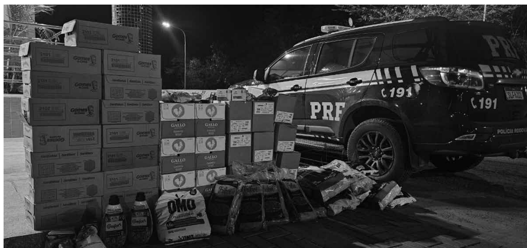
Mercadoria furtada consistia em 12 caixas de carne, avaliadas em cerca de R$ 2,5 mil

Já a mercadoria passará pelos trâmites cabíveis para ser devolvida ao seu legítimo dono.