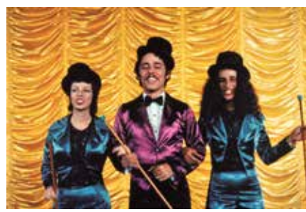
QUANDO O CARNAVAL CHEGAR

Um dos principais sucessos de bilheteria do Cinema Novo, mostrando que Diegues tinha uma comunicação com o grande público que era uma dificuldade para outros cineastas do movimento. O filme de 1966 mostra uma migrante nordestina que vai ao Rio em busca do noivo, mas descobre que ele virou um perigoso bandido.