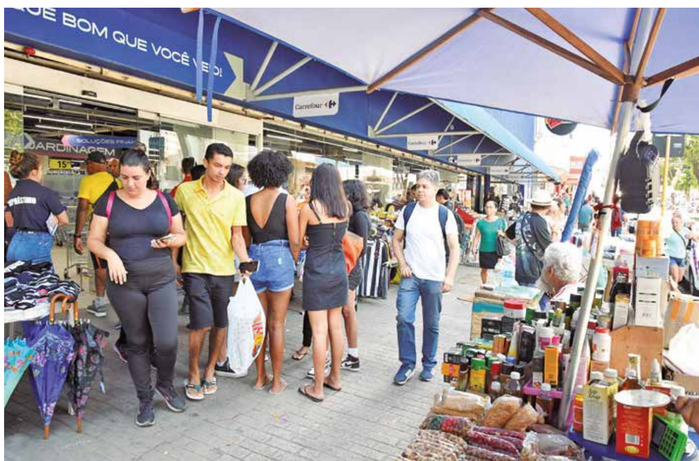
A taxa paraibana de informalidade permaneceu estável nos últimos três anos: 50,5%, em 2022; 49,8%, em 2023; e 50,6%, em 2024

A Pnad Contínua aponta que o rendimento médio mensal real de todos os trabalhos recebido pelos ocupados caiu de R$ 2.488, em 2023, para R$ 2.287, em 2024