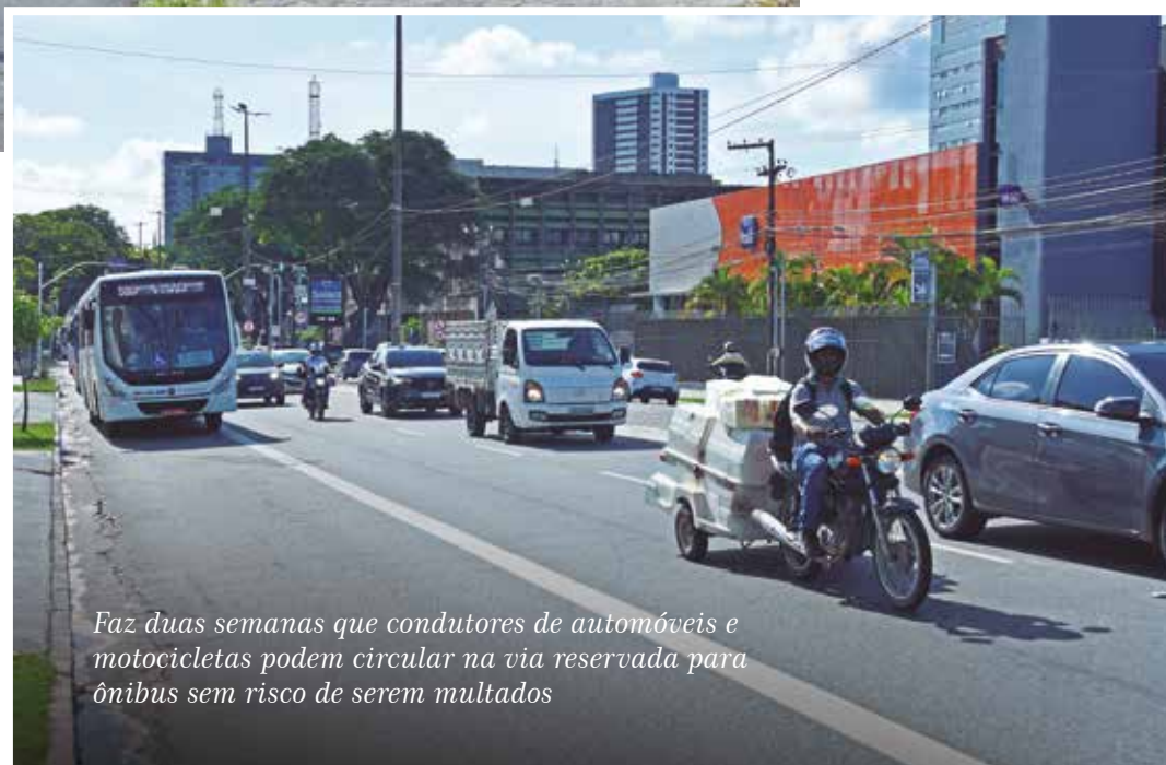
Faz duas semanas que condutores de automóveis e motocicletas podem circular na via reservada para ônibus sem risco de serem multados