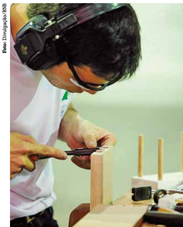
Programa pretende suprir demandas de trabalho do setor

Dentro das ações de consolidação do polo moveleiro paraibano na Região Metropolitana de João Pessoa, o Instituto Federal da Paraíba (IFPB) foi convidado a atuar na oferta de cursos de marcenaria e de montagem de móveis para suprir as demandas das empresas do setor. A partir de uma agenda de visitas a indústrias, a comissão que integra o Programa de Desenvolvimento Territorial (Prodeter) da Indústria Moveleira da Paraíba e o IFPB projetam a abertura de novos cursos. Inicialmente, o instituto deve abrir turmas em Cabedelo e avaliará essa possibilidade também para o polo de Santa Rita.