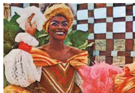
XICA DA SILVA

Em 1973, Cacá Diegues dirige a mítica atriz francesa Jeanne Moreau neste filme, uma coprodução com a França, com direção musical de Chico Buarque e Roberto Menescal. Ela é a dona de um prostíbulo, em 1930, que aceita o convite de um coronel para viajar com ele até seu engenho de açúcar.