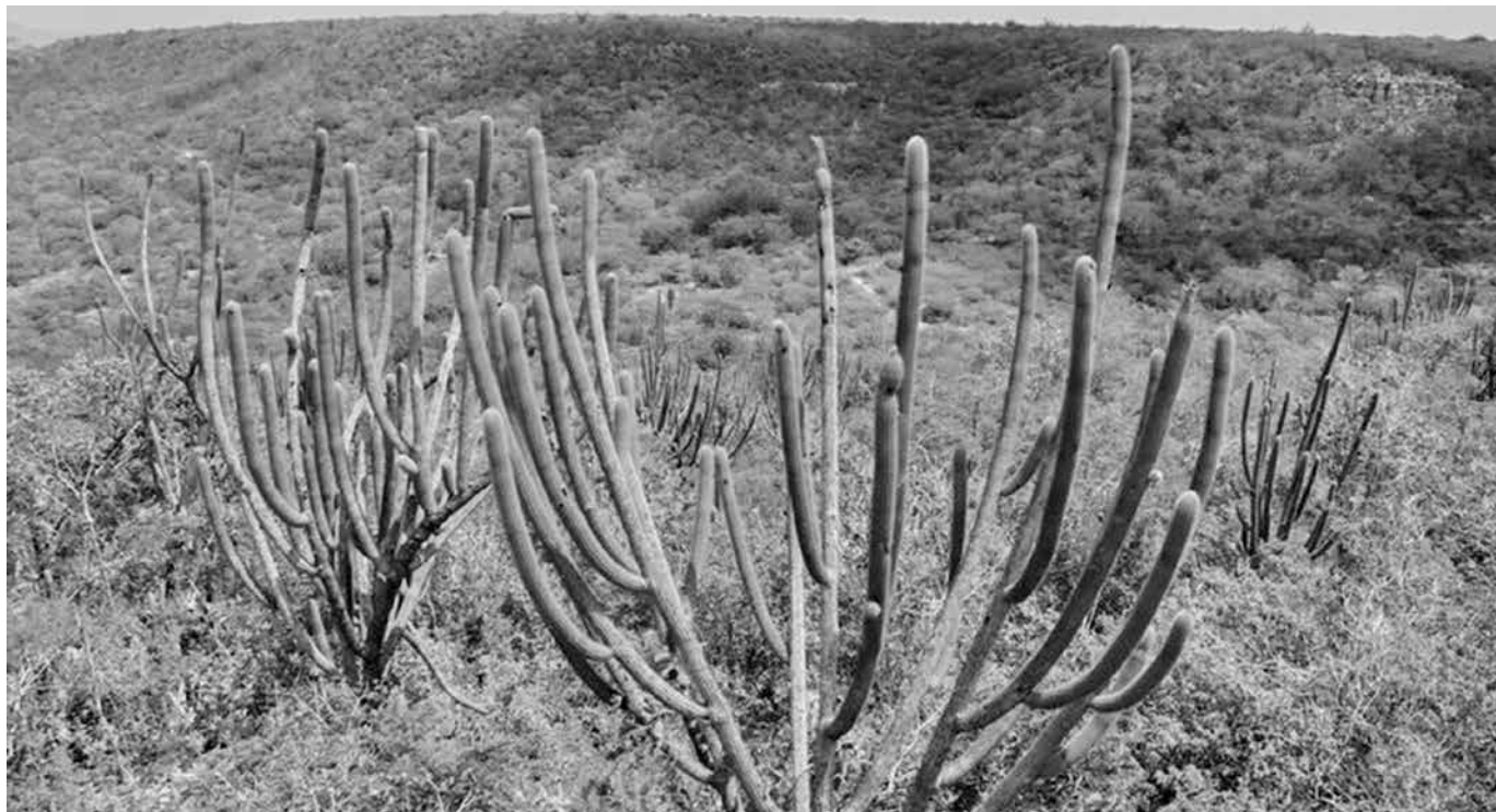
Região da Caatinga passa pelas cidades de Prata, Monteiro, Cabaceiras, São José dos Cordeiros, Queimadas e Cuité

■ Desde a semana passada, equipes do Sebrae-PB articulam as assinaturas com os municípios