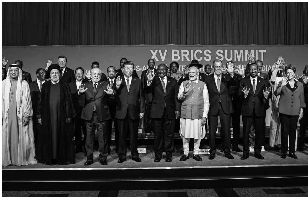
Líderes dos países do Brics acreditam que medida proporcionará benefícios econômicos

Para especialistas consultados pela reportagem, os EUA buscam preservar sua hegemonia econômica global, que tem no dólar como moeda internacional uma das suas principais vantagens. Por outro lado, os países do Brics defendem que o uso de moedas locais para o comércio traz benefícios eco-