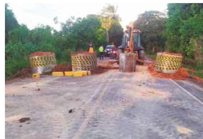
Decisão é para garantir a segurança da população

“Não haverá mais tráfego de veículos por essa ponte. Estamos criando estratégias para minimizar os transtornos causados por essa interdição, encurtando o tempo de tráfego do usuário, até que uma nova