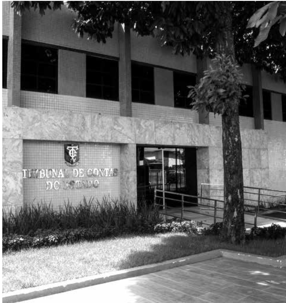
TCE está preocupado com o crescente número de pedidos de procedimentos cadastrais

Com o novo Siscad, o TCE busca não apenas modernizar seus processos, mas também aumentar a eficiência e a transparência nas interações com os jurisdicionados.