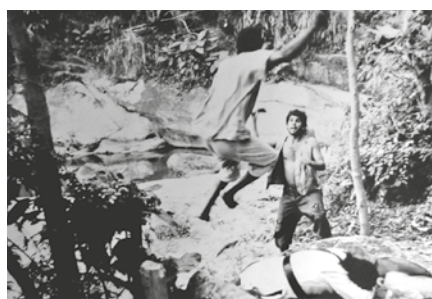
GANGA ZUMBA, REI DE PALMARES

O filme de 1962 foi o primeiro longa dirigido por Cacá Diegues, abordando a vida do primeiro líder do Quilombo de Palmares, símbolo da resistência de escravizados no Brasil. O diretor chegou a dirigir uma espécie de continuação em Quilombo , de 1984.