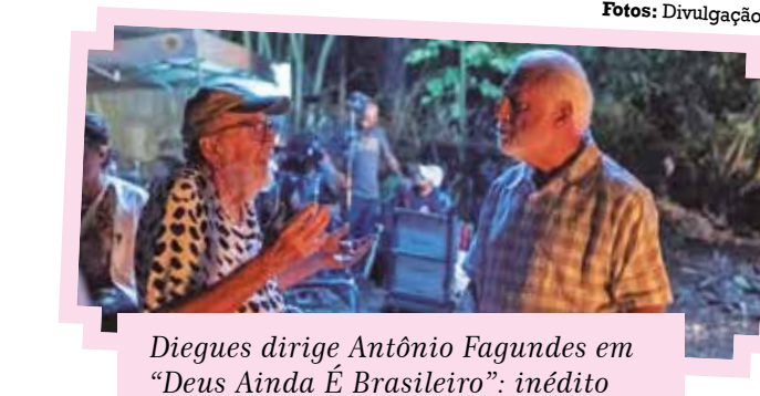
Diegues dirige Antônio Fagundes em “Deus Ainda É Brasileiro”: inédito