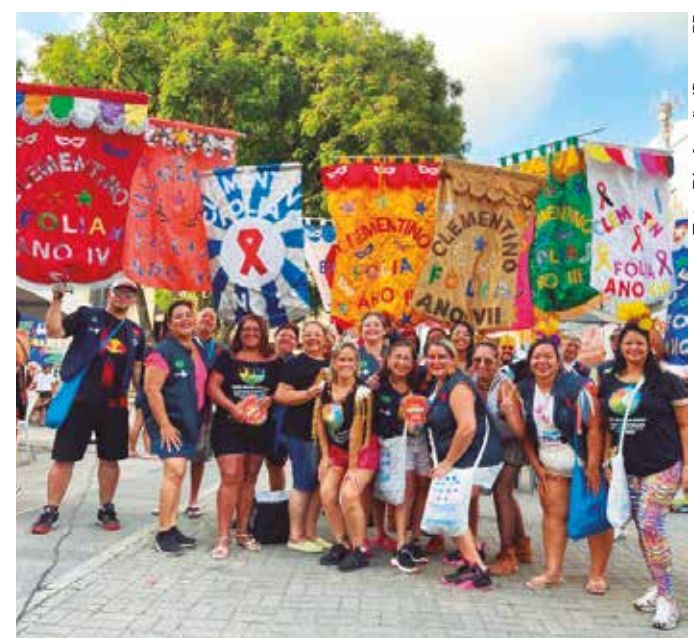
Equipe distribuirá material diverso entre os foliões do evento