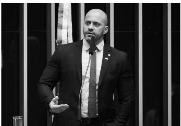
Ex-deputado cumpriu um terço da sentença de oito anos

Daniel Silveira foi condenado pelo STF a oito anos e nove meses de prisão por defender pautas antidemocráticas, como a destituição de ministros do tribunal e a Ditadura Militar. Ele já cumpriu um terço da pena e pagou a multa imposta na sentença, requisitos previstos na Lei de Execuções Penais para a liberdade provisória. No entanto, o descumprimento das medidas cautelares autoriza a revogação do benefício.