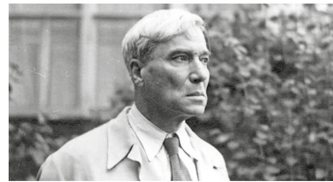
Autor de "Doutor Jivago", Pasternak também foi poeta