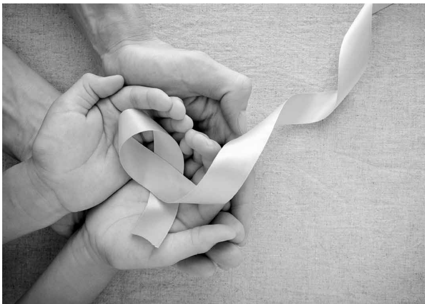
Câncer infantil é a principal causa de morte entre crianças e adolescentes com idade entre um e 19 anos, no Brasil

Por outro lado, é importante não privar completamente a criança da interação com familiares e amigos. “Por mais que não possam estar próximas fisicamente nesse período, é importante que a família e os amigos se façam presentes, temos hoje meios eletrônicos que podem ajudar esse contato”. O reencontro, avalia a especialista “pode acontecer quando for liberado pela equipe médica, de forma responsável, para que não haja risco de se transmitir nada para a criança durante o tratamento”.