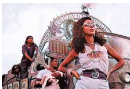
BYE BYE BRASIL

O romance atípico que Carlos Diegues dirigiu em 1978 não traz os galãs e mocinhas da época nos papéis principais. O casal central é formado pelo veterano Jofre Soares e Miriam Pires, que até protagonizam uma cena íntima. Ganhou quatro prêmios no Festival de Brasília, incluindo Melhor Atriz Coadjuvante para Miriam.