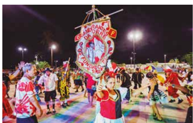
Prévias mostram a força e o entusiasmo das agremiações

"Nós estamos realizando as nossas prévias de Carnaval em 12 bairros, mostrando aos moradores dos territórios e das comunidades a força e a preparação que todas as agremiações do Carnaval Tradição têm. Todos estão muito qualificados para o Carnaval deste ano, e não tenho dúvida de que será tão forte quan-