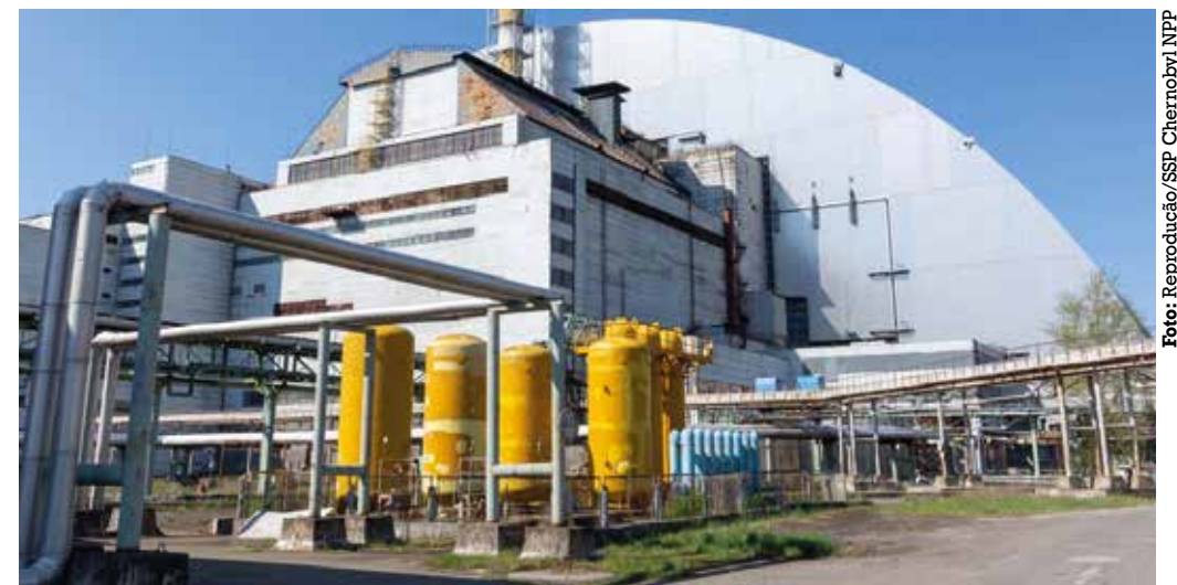
Níveis de radiação não aumentaram após a estrutura de contenção ter sido atingida por explosivo

“O único país no mundo capaz de atacar instalações desse tipo, ocupar o território de usinas nucleares e conduzir hostilidades sem qualquer consideração pelas consequências é a Rússia de hoje. E isso representa uma ameaça terrorista para o mundo inteiro”, escreveu ele. “A Rússia deve ser responsabilizada pelo que está fazendo”.