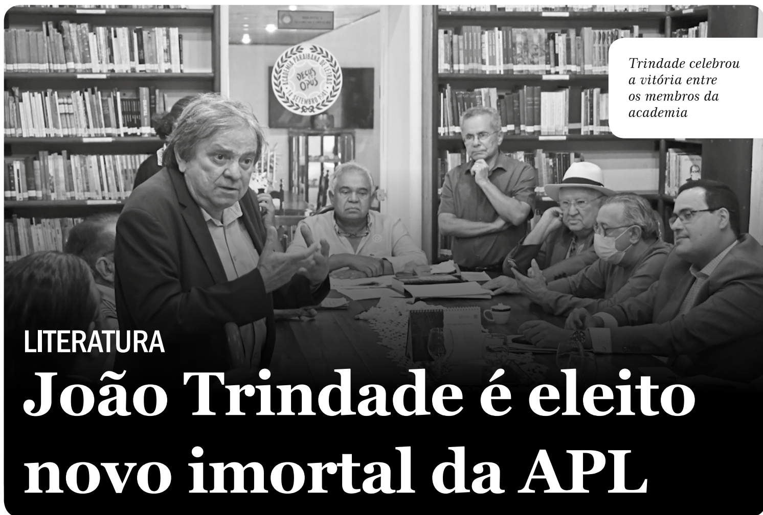
Trindade celebrou a vitória entre os membros da academia