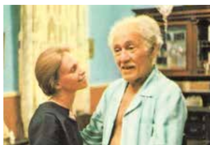
CHUVAS DE VERÃO

Um dos maiores sucessos de Carlos Diegues veio em 1976, estrelado por Zezé Motta, contando a história da escravizada que passa a dominar a situação com seu senhor, no século 18. Ganhou os prêmios de Melhor Filme, Diretor e Atriz no Festival de Brasília e compôs com Jorge Ben Jor a clássica canção-tema.