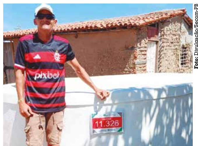
Reservatórios garantem acesso à água no Semiárido

O processo para a construção das cisternas pelo PB Rural Sustentável começa com a seleção das famílias, conduzida pela Empaer, em