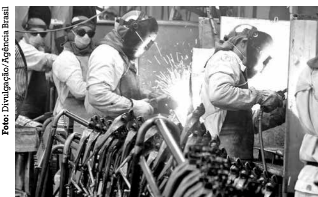
Comparando com dezembro de 2023, índice cresceu 2,4%

■ Apesar da alta anual, a atividade da economia brasileira em dezembro de 2024 apresentou recuo de 0,7%