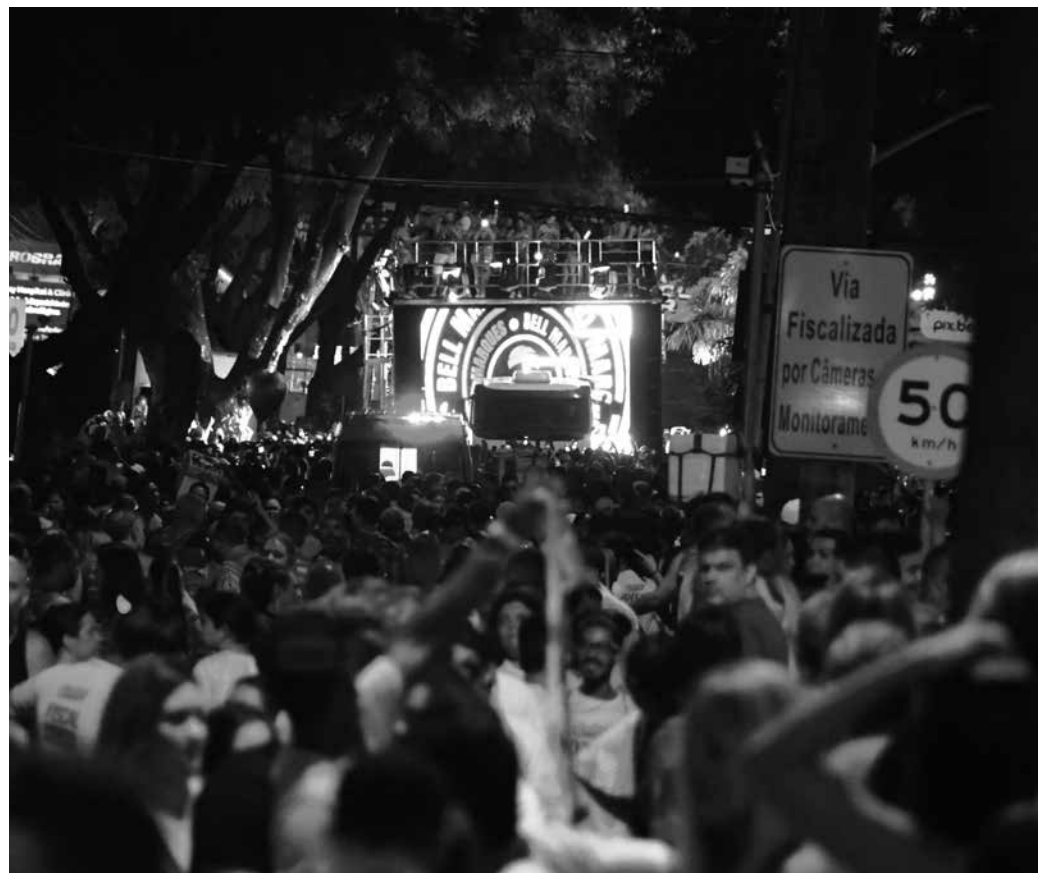
A Av. Epitácio Pessoa, onde desfilam os blocos do Via Folia, é um dos polos das prévias locais

O explorador do trabalho infantil, como lembra o TJPB, pode ser punido pelo crime de maus-tratos, com pena prevista de um a quatro anos de reclusão.