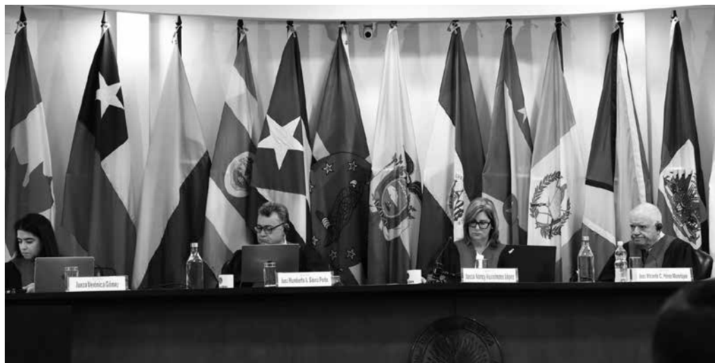
Membros da Corte IDH decidem hoje sobre acusação de omissão do Estado brasileiro

Diante das “diversas falhas do Estado brasileiro na investigação e na ação penal, bem como nas ações preventivas para combater com eficiência a violência no campo e promover o direito à terra”, as organizações petionárias do caso pedem que, além de reconhecer a omissão do Estado brasileiro, a