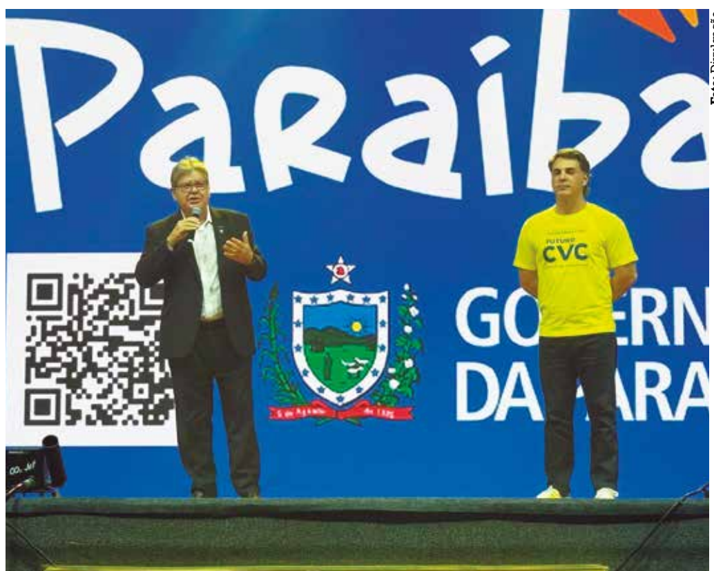
Governador da Paraíba destacou os investimentos no setor do turismo, do Litoral ao Sertão

“Nós temos feito investimentos em turismo na Paraíba, do Sertão ao Litoral. Vamos assinar mais um resort para o Polo Turístico Cabo Branco na próxima semana e mais outro em março, porque a iniciativa privada entendeu que o nosso estado oferece um ambiente propício para se investir em turismo, e eu agradeço à CVC pela homenagem