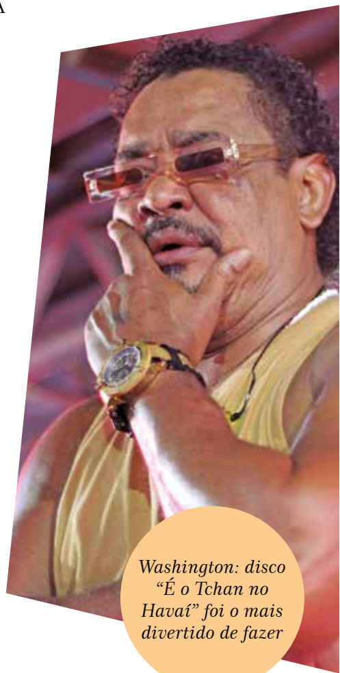
Washington: disco “É o Tchan no Havai” foi o mais divertido de fazer

Para mim, significa história, resistência e, acima de tudo, alegria. O É o Tchan segue vivo porque representa um momento especial da música brasileira”, conclui Washington.