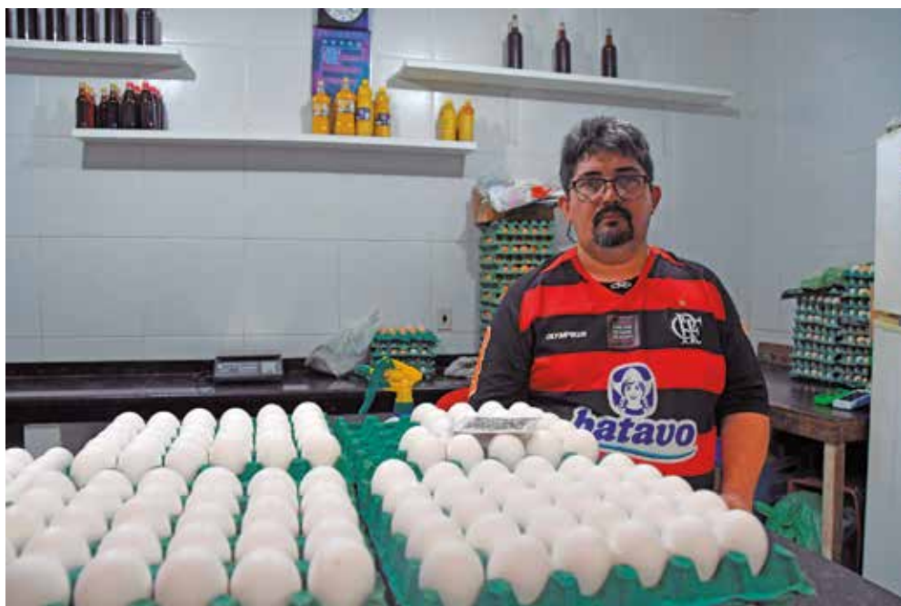
Comerciante acredita que, mesmo mais caro, consumidores continuarão comprando