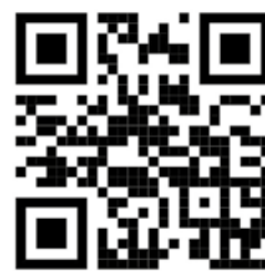
Pelo QR Code acima, acesse o e-Notariado

pode solicitar o serviço desejado diretamente na plataforma. O tabelião agendará uma videoconferência para confirmar a manifestação de vontade das partes, garantindo a validade jurídica do ato.