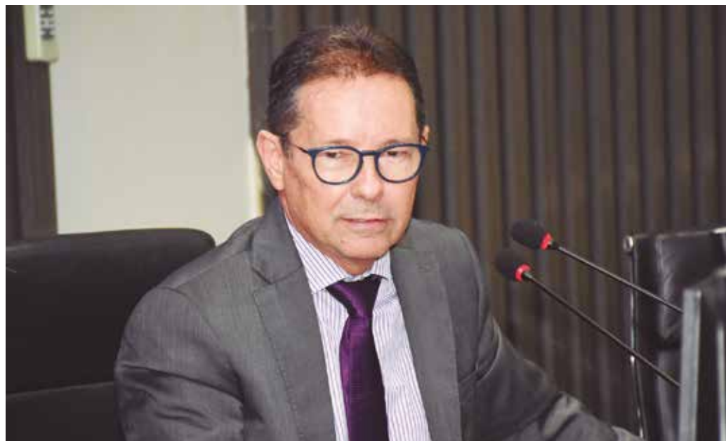
Leandro dos Santos: “Corregedoria cumprirá rigorosamente as determinações do CNJ”

Justiça do Tribunal de Justiça da Paraíba, desembargador Leandro dos Santos, que assumiu o cargo na segunda-feira (3), disse que a Corregedoria-Geral do TJPB vai cumprir, rigorosamente, as determinações da Corregedoria Nacional de Justiça. “Vamos, exatamente, definir medidas que tornem eficaz, pelo menos aqui na Paraíba, o que o Conselho Nacional de Justiça disciplina em sua resolução. Obviamente, vamos ler de forma detalhada toda a resolução, para que essa medida seja implementada no âmbito do estado da Paraíba”, afirmou o magistrado.