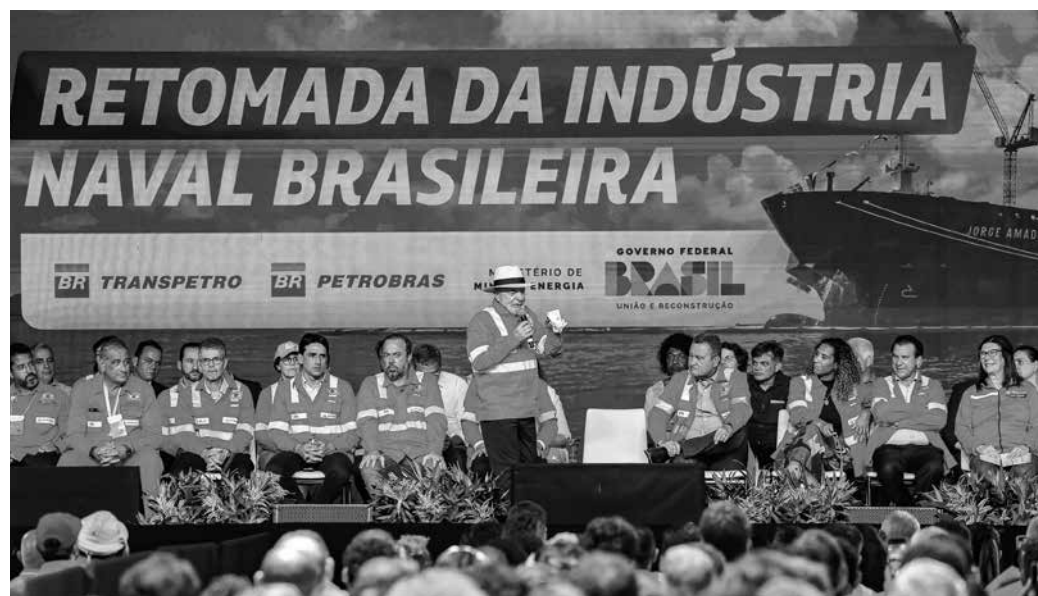
Declaração ocorreu durante evento de anúncio de investimentos para a estatal, em Angra dos Reis

De acordo com o governo, a ampliação da frota de gaseiros, de seis para 14 navios, leva em conta o aumento de produção de gás natural no país e pretende atender à demanda na costa brasileira e na navegação fluvial, como já ocorre na Região