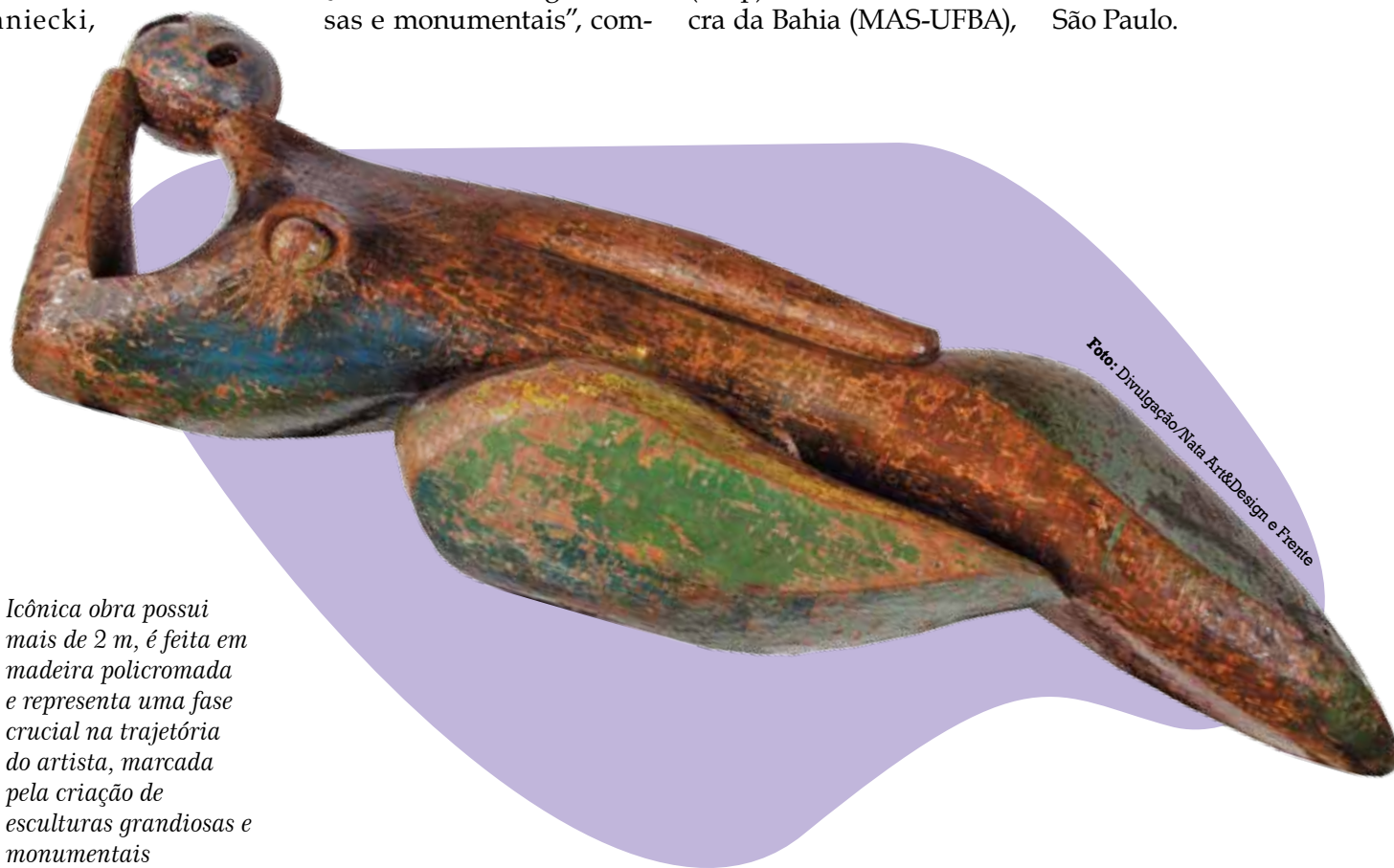
Ícônica obra possui mais de 2 m, é feita em madeira policromada e representa uma fase crucial na trajetória do artista, marcada pela criação de esculturas grandiosas e monumentais

A Mulher Reclinada está exposta no escritório de arte James Lisboa, na Rua Doutor Melo Alves, 397, em São Paulo.