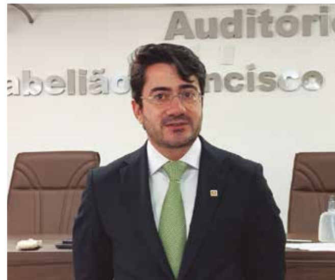
Carlos Ulysses destaca “papel essencial” dos cartórios