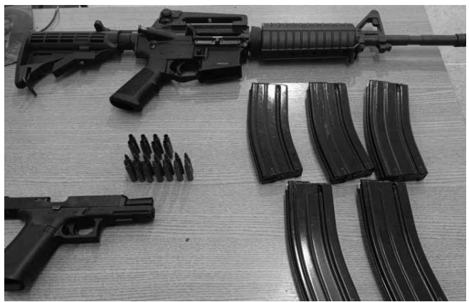
Além das armas, acusado possuía munições e carregadores

O homem foi preso e conduzido para a delegacia. Por se tratar de um