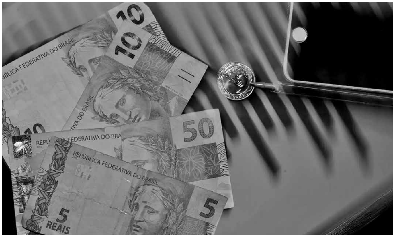
Por causa da inflação, o Comitê de Política Monetária já prevê mais um aumento de um ponto percentual em março

A taxa de investimentos da economia foi estimada em 17,2%, acima do registrado em 2023 (16,4%).